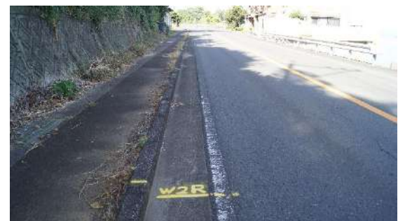
10.0975km(女子第 2 中継所)