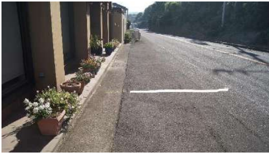
13.0975km(女子第 3 中継所) ※店舗前につきラインは有りません。鉾のみ