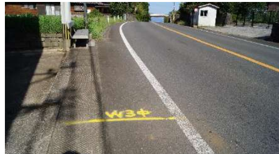
11.5975km(女子 3 区中間)