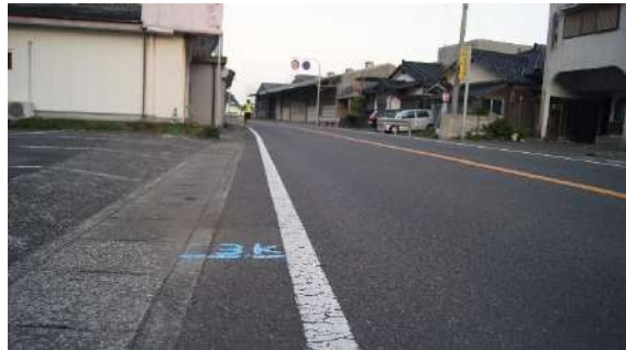
3.0km (女子 1 区中間)