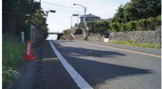
11.62474km(女子折り返し地点)