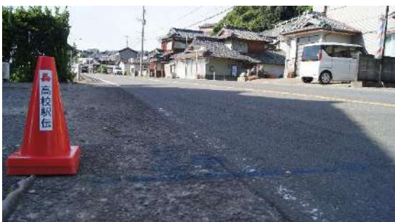
37.195km(男子第 6・女子第 4 中継所) ※個人宅前につきラインは有りません。鉾のみ