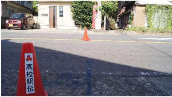
16.0975km(男子第6・女子第4 中継所)