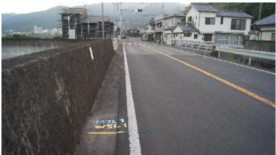
20.0975km(男子7区・女子5区あと1km)