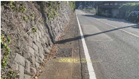
14.5975km(女子 4 区中間)