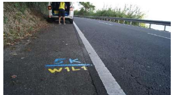
5.0km(男子 1 区中間・女子 1 区あと 1 km)