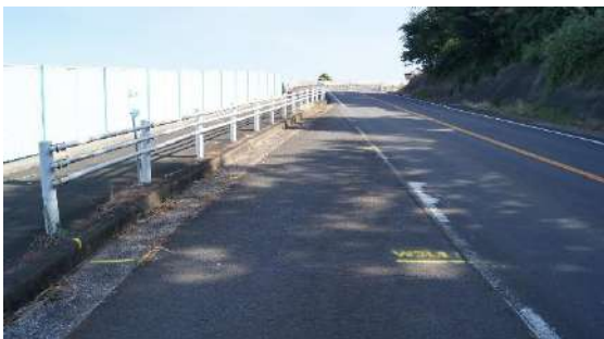
12.0975km (女子 3 区あと 1 km)