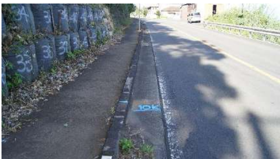
10.0km(男子第 1 中継所)