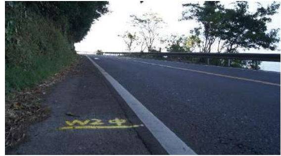
8.04875km(女子 2 区中間)