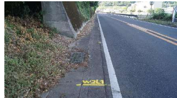
9.0975km(女子 2 区あと 1 km)