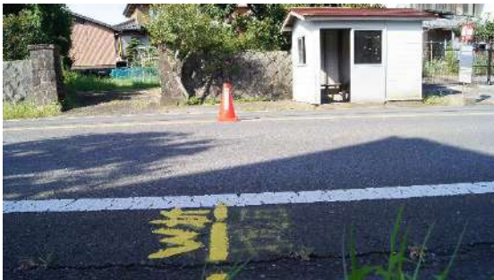
11.62474km(女子折り返し地点)