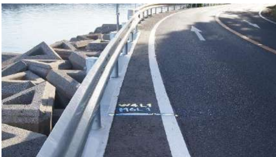
15.0975km(男子 6 区・女子 4 区あと 1 km)