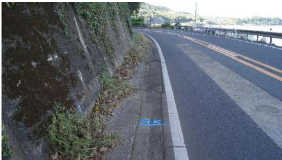
9.0km(男子 1 区あと 1 km)