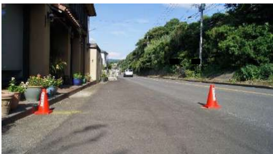
34.195km(女子第 3 中継所) ※店舗前につきラインは無し。鋸のみ。路側帯で中継