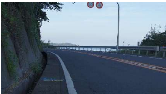
6.0km(女子第 1 中継所)