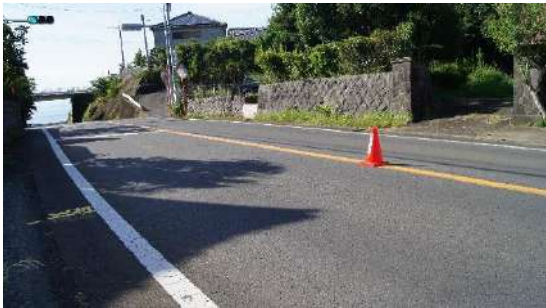
11.62474km(女子折り返し地点)