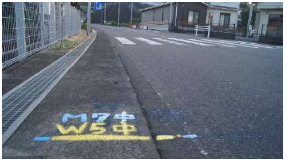
18.5975km(男子7区・女子5区中間)